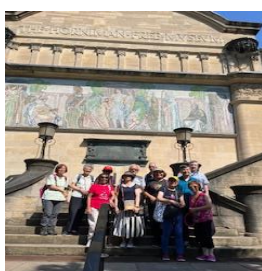
Horniman Museum 一日游